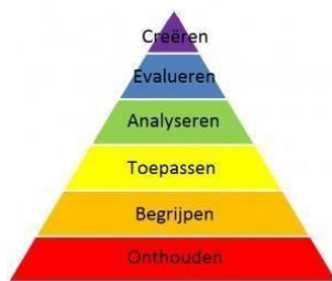
Tabel 1: de taxonomie van Bloom

Säljö (1979) bevroeg 90 mensen over de betekenis van 'leren'. Hij kwam tot de volgende indeling die sterk aanleunt bij de taxonomie van Bloom: “(1) Learning as the increase of knowledge (2) Learning as memorising (3) Learning as the acquisition of facts or procedures (understand) (4) Learning as the abstraction of meaning (5) Learning as an interpretative process aimed at the understanding of reality.” (Säljö, 1979, in Krathwohl, 2002, pp. 213–217).